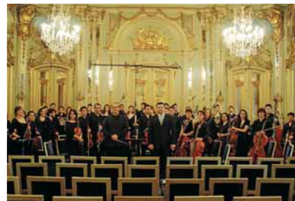
La versió reduïda de l'orquestra actuà al Palácio Foz.