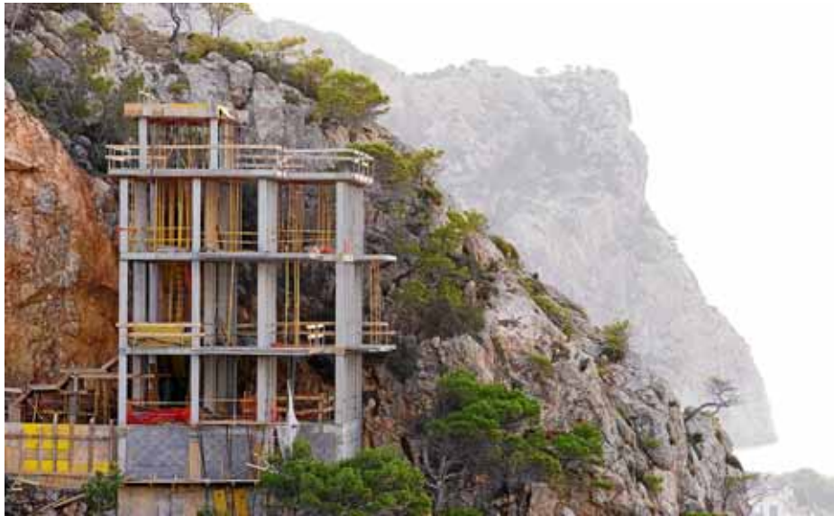
Els ajuntaments que ho desitgin delegaran algunes competències d'Urbanisme al Consell.

Ara per ara, encara està per determinar com les administracions municipals participaran en aquesta agència. Sembla ser que aquells ajuntaments que s'hi afegeixin, ho faran de manera voluntària. Això comportarà que, a partir d'aquest moment, els municipis delegaran les seves competències d'inspecció urbanística al Consell.