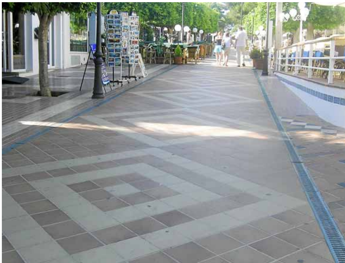
L'avinguda de Bèlgica, a Cala d'Or, lloc on ocorregueren els fets.

L'Obra Cultural Balear es posà en contacte ahir amb Estelrich. Li demanaren si volia denunciar els fets a l'Oficina de Drets Lingüístics. El suposat agredit, però, declinà la proposta ja que trobava que "amb el trull que s'ha mogut ja n'hi ha ben a bastament".