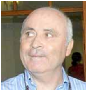
Fernando Areal Exgerent del PP Partit polític: PP 1 imputació pel cas Palma Arena , inclou el cas Buckingham. Cunyat de Matas.