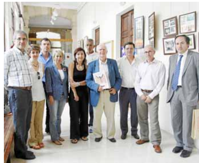
Presentació de la Universitat Catalana d'Estiu.