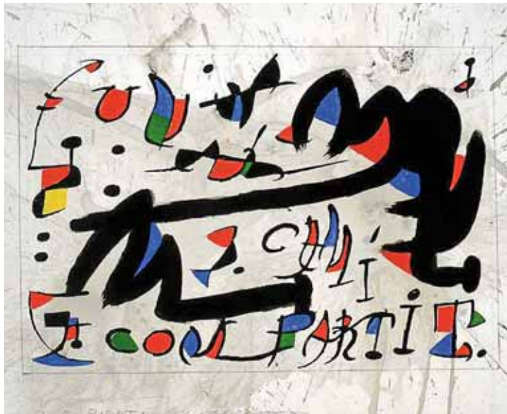
Un camí compartit, 1975. Tinta xinesa, aiguada i aquarel·la sobre paper.