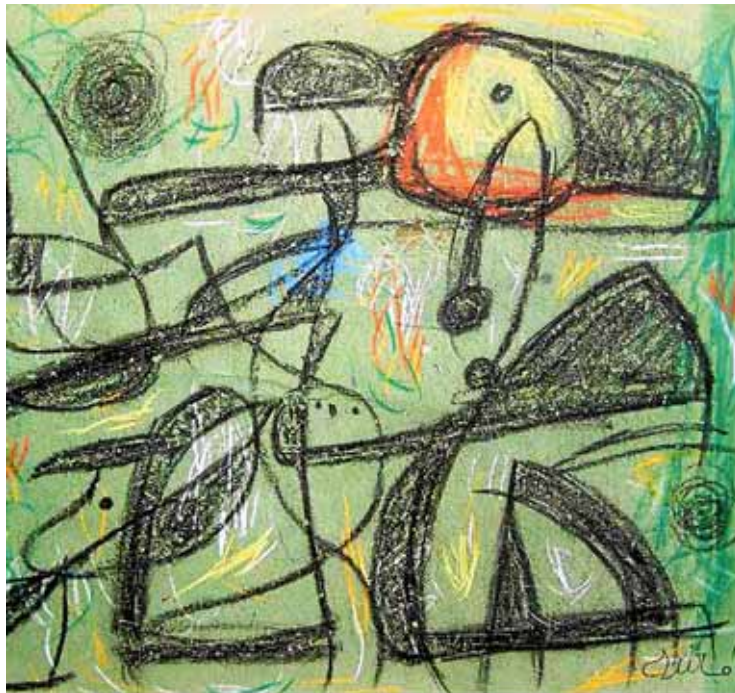
Femme, oiseau, 27/1/77. Cera i pastels sobre una cartolina de 39 x 48,5 cm.