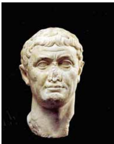
Marc Antoni, esculpit fa 2.030 anys.