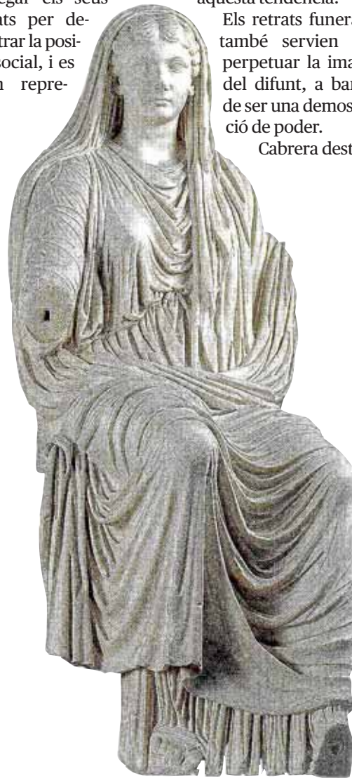
L'emperadriu Livia, en marbre.

Aprofitant que el museu madrileny es troba en obres i té tancades 32 de les 36 sales que conté, part de la seva col·lecció es mostra en diverses exposicions itinerants. En el cas de la proposta que ara arriba a Palma, es va estrenar a principi de 2008 a Alacant, i Ciutat és la segona destinació del seu recorregut. •