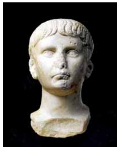
Escultura d'un jove emperador Neró.