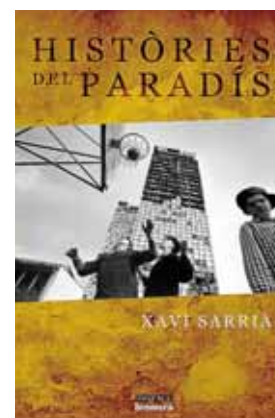
Portada del llibre.